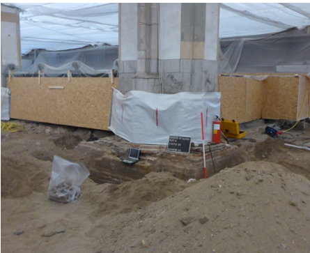
Werkzaamheden in de Grote of Sint Michaëlskerk '19

Muziek: A capella koor Blent Organisatie: Zwolse Historische Vereniging, Monumentenzorg en Archeologie gemeente Zwolle, Academiehuis de Grote Kerk