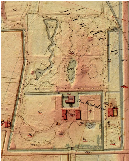
Nieuw kaartbeeld van het landschapspark, Windesheim