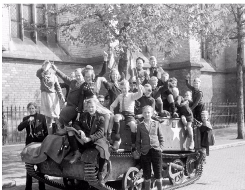
Bevrijding Zwolle, Grote Kerkplein, 1945

Muziek: Muziekvereniging Excelsior Westenholte Organisatie: Allemaal Zwolle en Waanders In de Broeren