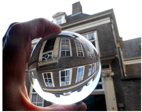
Pand aan de Koestraat 8, Zwolle