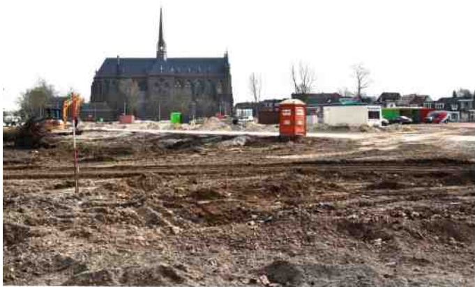
Herontwikkeling ziekenhuislocatie: van afstand is de Dominicanenkerk aan de Assendorperstraat zichtbaar.