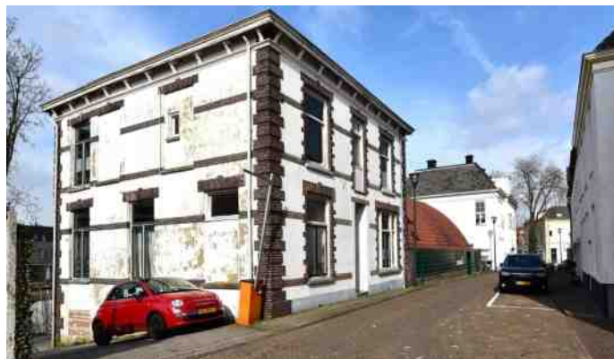
Herontwikkeling, een alternatief voor de onverkoopbare stadsvilla's aan de Eekwal.