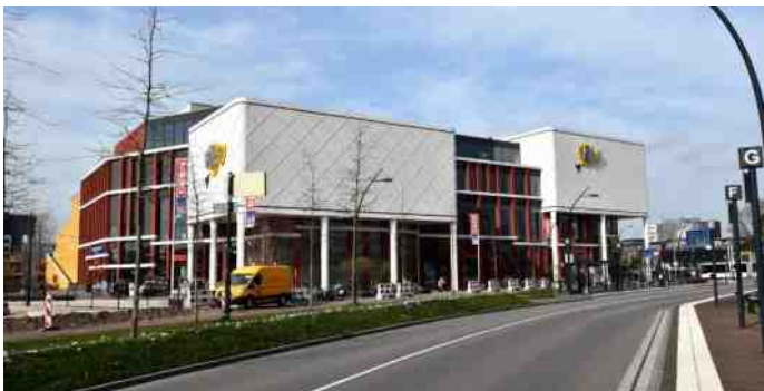
De nieuwe Pathébioscoop gezien vanaf de Pannekoekendijk.