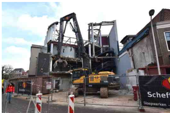
De sloop van de voormalige bioscoop De Kroon aan het Gasthuisplein.

Ook de Vrienden zijn hier nauw bij betrokken, en zijn voornemens een uitgebreide reactie op te stellen. In het volgende kwartaalbericht zullen wij u hierover informeren.