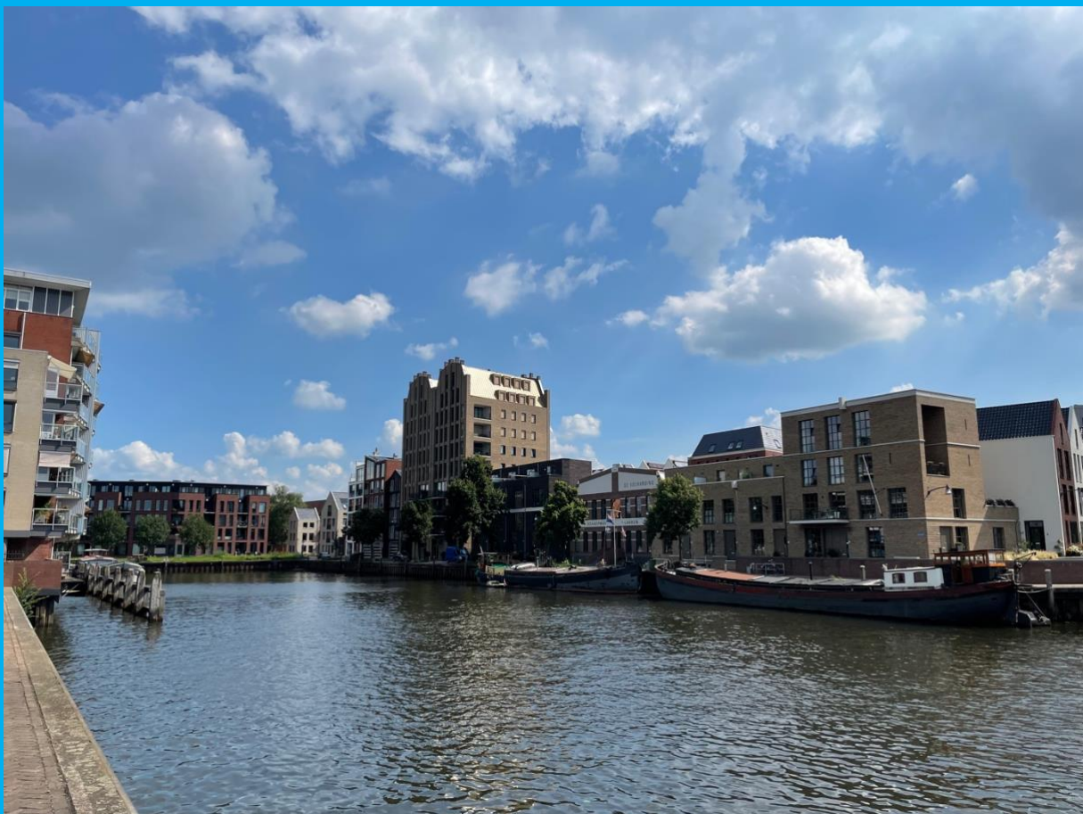
GEZICHT OP DE FRIESEWAL