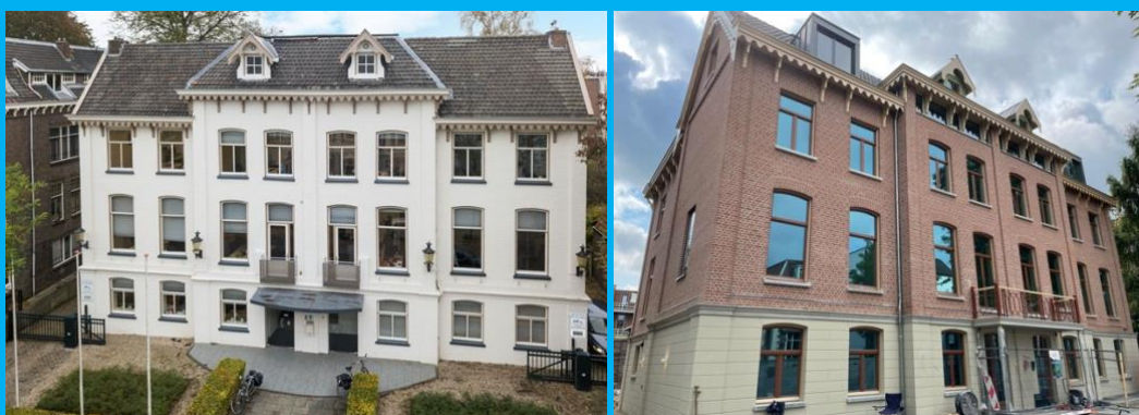
TERBORGHSTRAAT 13 OUD & NIEUW