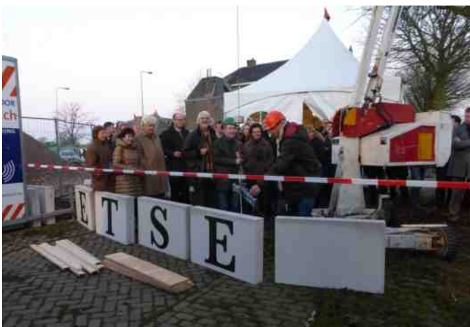
De eerste groep bewoners van appartementengebouw De Stelling tijdens de officiële start van de bouw op 10 december.

Op 10 december jl. is met enig officieel vertoon de bouw van het Kraanbolwerk van start gegaan. De bodemsanering is gereed zodat met de bouw van de parkeergarage begonnen kan worden.