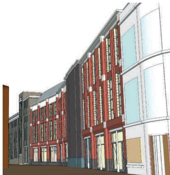
Warehouse, gevel Voorstraat

Het bestuur van de Vrienden is van mening dat er een groot maar in de omgeving passend warehouse aan Melkmarkt én Voorstraat komt te staan. Een belangrijke opsteker voor de bedrijvigheid voor dit deel van de binnenstad.