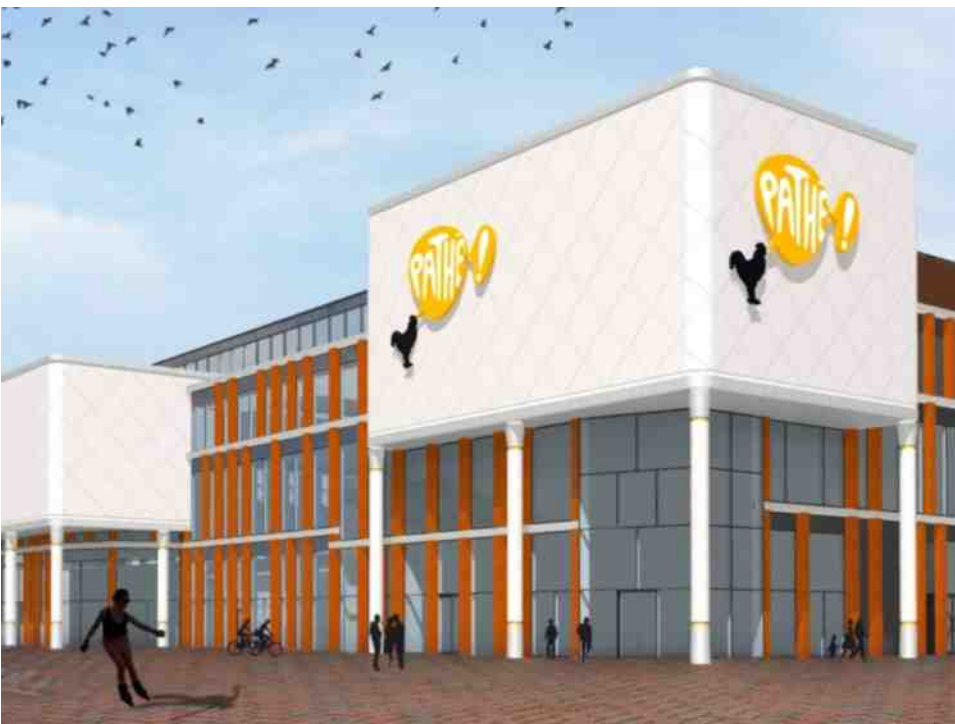
De bioscoop, gezien vanaf de hoek Pannenkoekendijk - Katerdijk