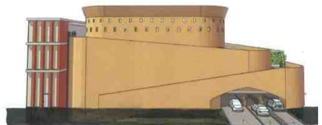
De parkeergarage aan de Katerdijk

In het gepresenteerde ontwerp is er voor gekozen bioscoop en parkeergarage als zelfstandige gebouwen te zien elk met een