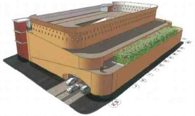
De parkeergarage in vogelvlucht

Indien onbestelbaar: Postbus 1180 8001 BB Zwolle