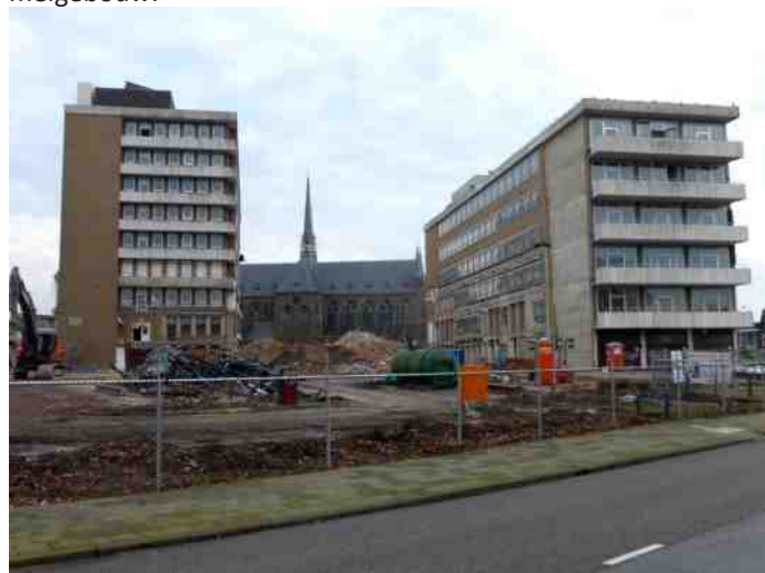
Sloop ziekenhuis De Weezenlanden

Over de uitwerking van de nieuwe woonwijk op het ziekenhuis is het al een tijdje stil geweest. Begin 2016 willen we de architecten eens vragen hoe ver de plannen zijn ontwikkeld. Met name de gebouwen langs de Luttenbergstraat moeten naar de mening van de Vrienden harmoniëren met de moderne(re) architectuur van Rechtbank, Provinciehuis en het kantoorverzamergebouw.