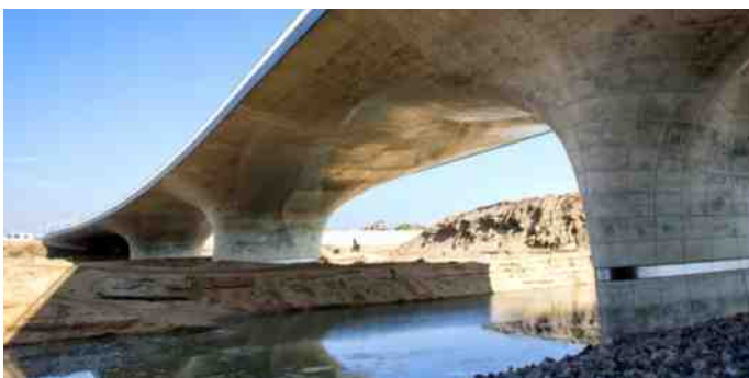
Nieuwe Verlengde Waalbrug Nijmegen

Veel bruggen zijn niet veel meer dan een paar poten met een blad erover. De busbrug moet meer dan dat worden. Met enige jalousie is gewezen op architectuur van de nieuwe Verlengde Waalbrug in Nijmegen. Zo kan een brug er ook uitzien!